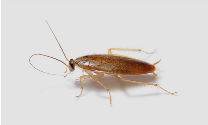
Schabe stark vergrößert