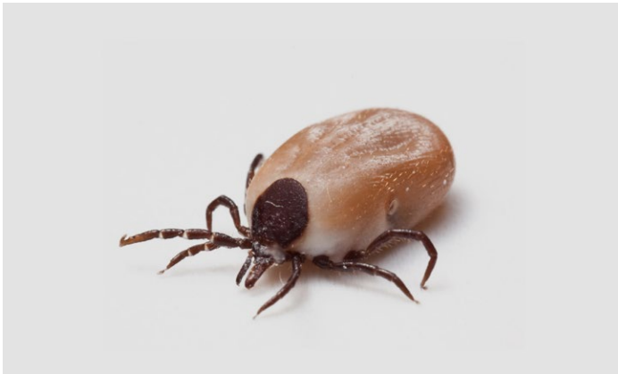
Zecke stark vergrößert

DIE GRAUEN BIS SCHWARZBRAUNEN ZECKEN gehören zu den Milben und sind weltweit mit 900 Arten verbreitet. Sie sind Ektoparasiten und befallen neben dem Menschen Vögel und Säugetiere um Blut zu saugen. Weibliche Zecken saugen bedeutend mehr Blut als Männchen. Dabei können sie gefährliche Krankheiten wie FSME oder Borreliose übertragen. Zecken haben meist in jedem Entwicklungsstadium eine andere Wirtsart. Sie leben im Gras von Wäldern, Gärten oder Parks.