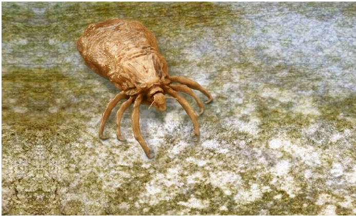
Kopflaus stark vergrößert

Kopfläuse sind flügellose Insekten, durchsichtig bis rötlich und nur wenige mm klein, aber mit freiem Auge sichtbar. Sie können nicht springen oder fliegen, sondern kriechen von Kopf zu Kopf. Vor allem Kindergarten- und Volksschulkinder stecken oft die Köpfe zusammen, darum sind sie bevorzugte Opfer. Kopfläuse haben nichts mit mangelnder Hygiene zu tun und übertragen keine Krankheiten! Sie sind harmlos, aber lästig.