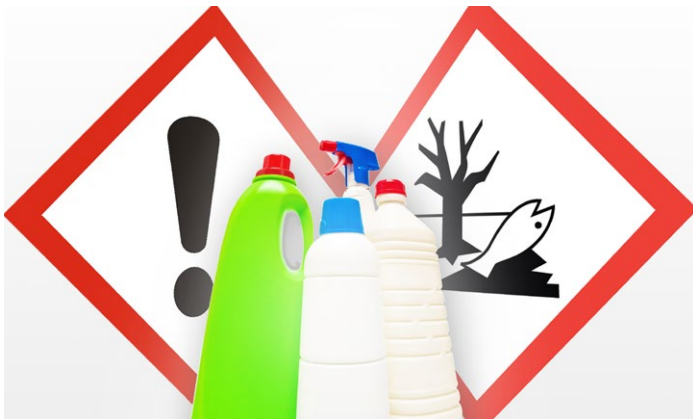
Gefahrenkennzeichnung auf Produkten

DER SICHERE UMGANG mit „gefährlichen“ Chemikalien: 2013 führte "die umweltberatung" im Auftrag des Umweltministeriums eine Marktanalyse durch, um zu erfassen, welche Produkte mit gefährlichen Eigenschaften, wie zum Beispiel ätzenden oder gesundheitsschädlichen Eigenschaften, in Geschäften mit Selbstbedienung oder im Fachhandel mit Bedienung verkauft werden dürfen.