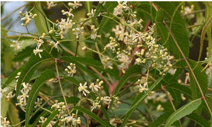
Neembaum mit Blüten

Natürliches Pyrethrum wird aus Pflanzen gewonnen. Synthetische Pyrethroide sind chemisch hergestellte Nachahmungen des natürlichen Pyrethrums. Sie sind Nervengifte und wirken schon in sehr geringen Mengen gegen fliegende und krabbelnde Insekten. Beim Menschen können sie Juckreiz, Hautentzündungen, Hustenreiz, Allergien u. A. auslösen. Sie werden nicht so leicht über die Haut oder nach Verschlucken vom Körper aufgenommen, sehr wohl aber über die Lunge. Besondere Vorsicht beim Versprühen von solchen Stoffen!