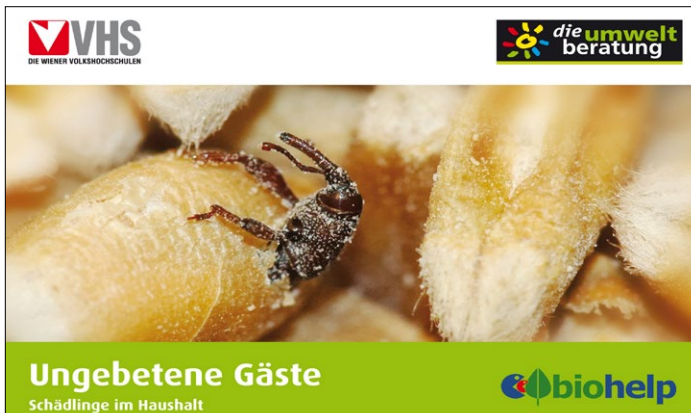
Poster - Ungebetene Gäste

Download: www.umweltberatung.at/poster-ungebetene-gaeste