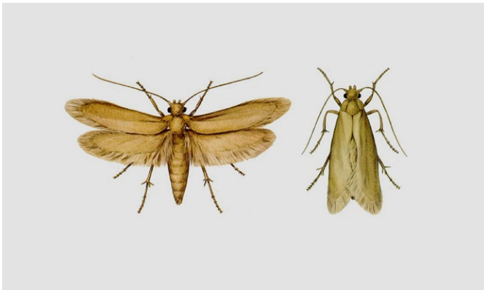
Kleidermotten stark vergrößert

KLEIDERMOTTEN SIND GRAUBEIGE SCHMETTERLINGE und bis 7 mm lang. Die Raupen sind bis 10 mm groß, weißlich und ziehen Gespinströhren hinter sich her. Sie sind lichtscheu, dämmerungs- und nachtaktiv. Textilschädlinge fressen tierische Fasern wie Wolle, Federn und Pelze und verursachen Schäden an Kleidung, Pelzen und Wollteppichen. Kunstfasern und Pflanzenfasern wie Baumwolle fressen sie nicht, aber Mischgewebe mit über 20 % Wollgehalt. Produkte aus reiner Wolle sind oft chemisch gegen Motten- und Käferfraß ausgerüstet. Die Chemikalien sind an den Fasern fixiert und machen sie für den Schädling ungenießbar. Löcher in Baumwolltextilien sind durch schlechte Qualität der Baumwolle verursacht und haben nichts mit Mottenfraß zu tun.