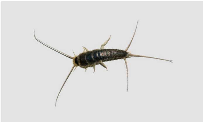
Silberfischchen stark vergrößert

SILBERFISCHCHEN SIND 8 - 11 mm lange, flügellose Insekten mit zwei Fühlern und silbrig glänzendem Körper mit drei Borsten am Hinterende. Sie brauchen Temperaturen von 20-30 °C und Luftfeuchtigkeit von über 70 %, weshalb sie vor allem in Bad, Küche und Toilette sind. Sie sind scheu und nachtaktiv und verstecken sich in Ritzen, Fugen und Abflüssen. Sie vermehren sich sehr langsam, deshalb gibt es nur sehr selten Massenauf-treten. Silberfischchen fressen Schimmelpilze, Zucker, Papier, Leim und andere stärkehaltige Produkte sowie Hautschuppen und Hausstaubmilben. In Neubauten treten Silberfischchen vermehrt auf. Wenn die Baufeuchtigkeit verschwunden ist, sind sie auch wieder weg.