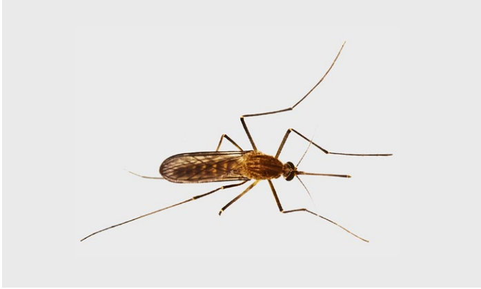
Gelse stark vergrößert

Wasseroberflächen. Die Larven und Puppen leben im Wasser. Gartenteiche sind aufgrund der Teichtiere, die die Gelsenlarven fressen, keine Gelsenzuchtstätte! Gelsen überwintern in Kellern, Ställen und an feuchten Stellen im Haus.