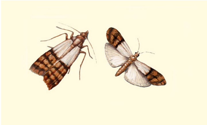
Lebensmittelmotten stark vergrößert