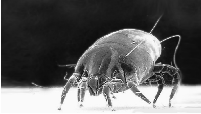
Hausstaubmilbe stark vergrößert