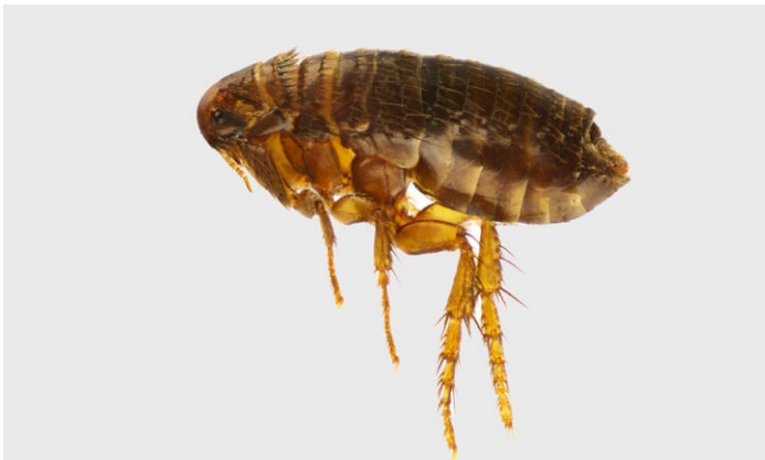
Floh stark vergrößert

FLÖHE SIND 2-5 MM GROSSE , flügellose, schwarz-braune Insekten und parasitieren Menschen und Tiere. In Mitteleuropa gibt es etwa 70 Arten. Sie haben stark verdickte Hinterbeine, mit denen sie bis zu einem Meter weit springen können. Ihre Eier