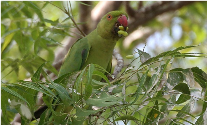
Neembaum mit Früchten

sollten vermieden werden, da viele von ihnen auch für Menschen giftig sind und die Umwelt gefährden. In Innenräumen haben sie noch ein viel größeres Gefährdungspotential als im Freien. Die bioziden (abtötenden) Wirkstoffe lagern sich auf Oberflächen von Wänden, Böden und Einrichtungsgegenständen ab und werden langsam wieder an die Raumluft abgegeben. Über die Atmung, durch Kontakt mit den belasteten Oberflächen und über den immer vorhandenen Schwebstaub werden sie in den Körper aufgenommen.