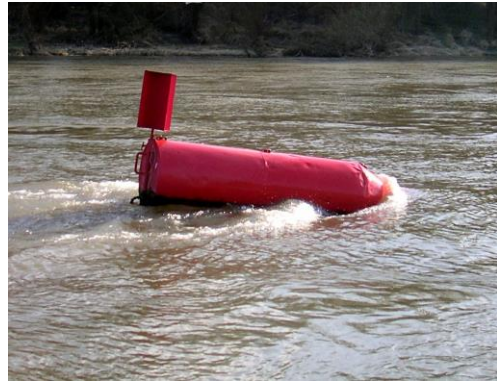
rechte Seite des Fahrwassers

Kennzeichnung der Schifffahrtsrinne für die Großschifffahrt