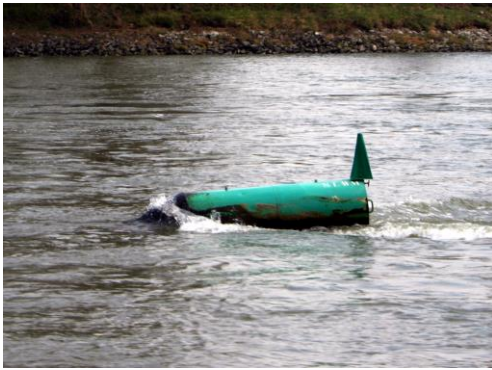
linke Seite des Fahrwassers

Schwimmende Fahrwasserzeichen (Tonnen, Bojen), nur auf Wasserstraßen